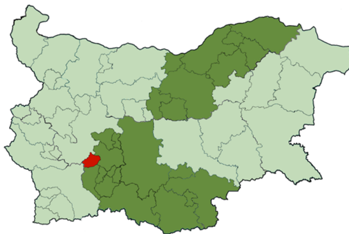
Фигура 1 Местоположение на Община Белово

Разположението на община Белово е показано на Фигура 1.