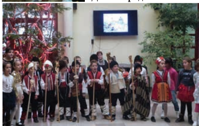
СУ „Ал. Иванов - Чапай“ Белово