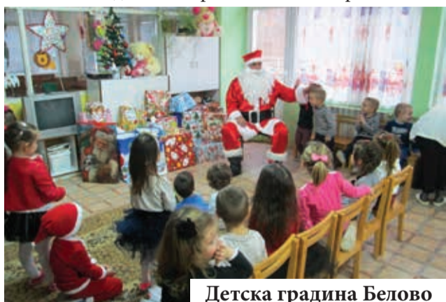
Детска градина Белово

настроение на всички, а коледарите обиколиха общината и с коледарските си песни пожелаха на всички здраве, щастие и берекет.